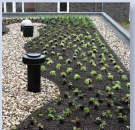
15. das Dach nach der Montage