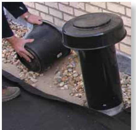
9. Vegetationsfreie Zonen mit Kies verfüllen