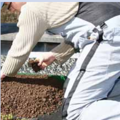
13. ND Sedumpflanzen verteilen und pflanzen (mindestens 16 Stück/m 2 )