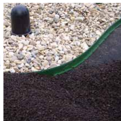
12. an vegetationsfreie Bereiche um Dachdurchdringungen/Kontrollschächte denken