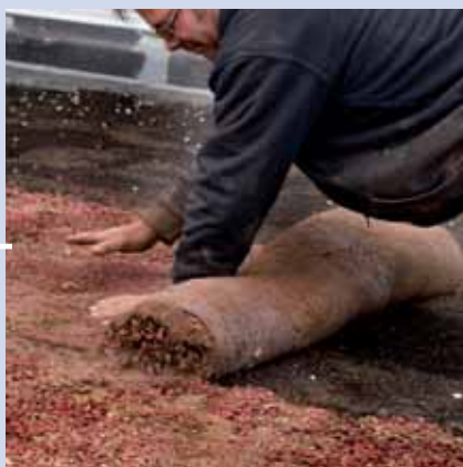
14. oder ND Vegetationsmatte ausrollen