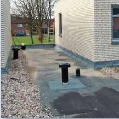
1. die Ausgangssituation: ein 0°-Flachdach mit einer wurzelfesten Bitumenabdichtung