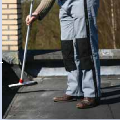
2. besenrein säubern