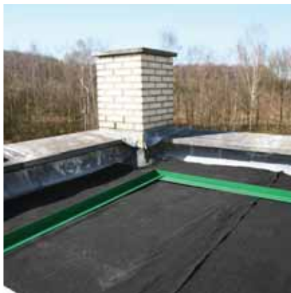
8. GreenLiner Randabgrenzungsprofile zuschneiden