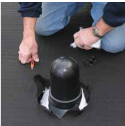
7. Dachdurchdringungen ausschneiden