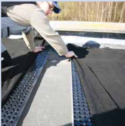
4. nächste ND 5+1 Dränagematte verlegen