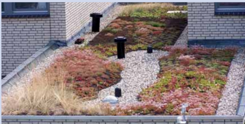
Die Dachbegrünung ein paar Monate nach der Fertigstellung.

Viele Kommunen fördern Dachbegrünungen durch Reduzierung der Versiegelungsgebühr!