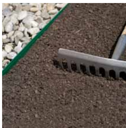
11. ND DGSE Dachbegrünungssubstrat gleichmäßig 5 – 8 cm dick verteilen