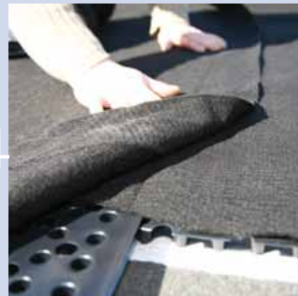
6. Filtervlies überlappend verlegen