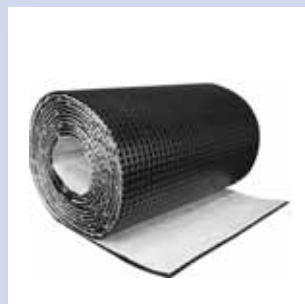
ND 4+1 und ND 5+1 Dränagematte