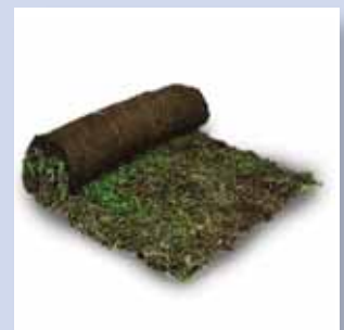
ND Fertigpflanzen / ND Vegetationsmatten / ND Sedumsprossen