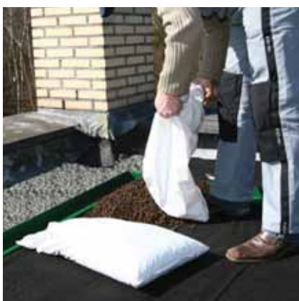
10. Dachbegrünungssubstrat ND DGSE in Säcken gleichmäßig auf dem Dach auslegen