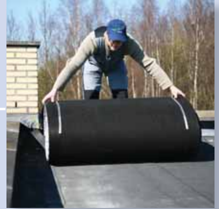
3. Dränagematte positionieren und ausrollen