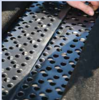
5. Bahnen aneinander legen und leicht überlappen